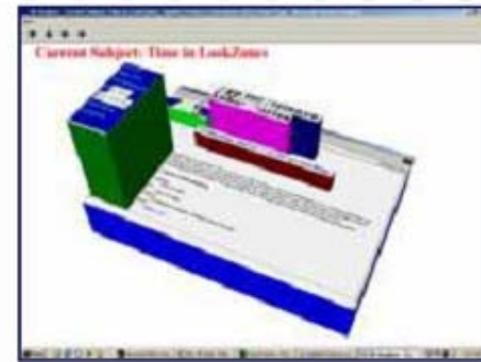
根据在不同兴趣区域上花费的时间进行3D网站浏览分析